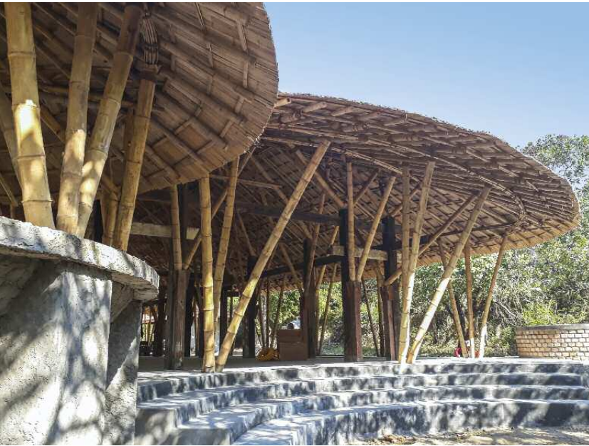
Myanmar: Die offen und luftdurchlässig gestaltetet 25 Meter lange und circa sechs Meter hohe Mehrzweckhalle des Zentrums ist vollständig aus Bambus errichtet und mit Bambusschindeln gedeckt.

Stampflehm oder Lehmziegeln, die Jahrhunderte überstanden haben. Insgesamt ist eine mehrgeschos- sige Bauweise im Lehm- bau jedoch nur sehr eingeschränkt möglich. Lehm- bau eignet sich daher besonders für ländliche und vorstädtische Wohnbauten, für Schulen, Sozialgebäude etc. Muss die Erde aus großer Entfernung herangeschafft werden, etwa in Gebieten mit sandigen oder steinigen Böden, sind andere Bauweisen zu erwägen.