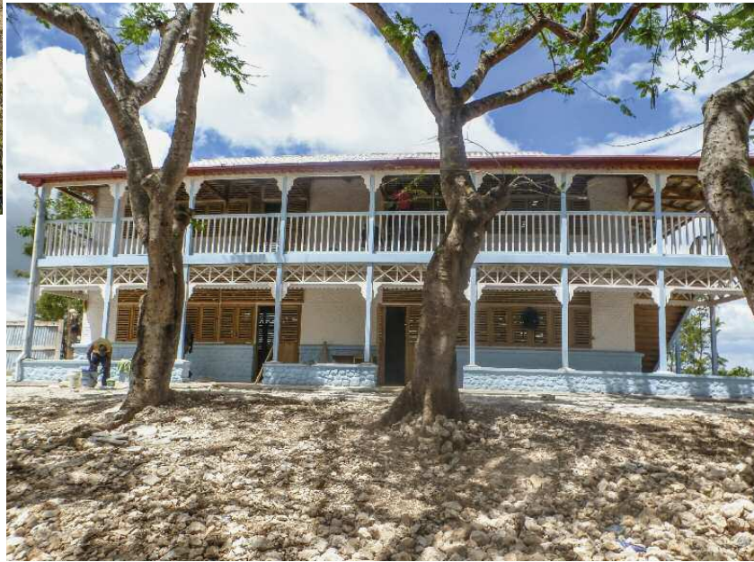
Haiti: Die Ausführung der Schule erfolgte in gemischter Holz-Lehmbauweise (Holzfachwerk mit Ausfachung in Lehmziegeln). Das Gebäude ist erdbebensicher erstellt.

Für das Bauen mit Erde braucht es zunächst nur - verbreitet vorhandenen - tonhaltigen Boden. Oft wird der Lehm an der Baustelle oder aus einer nahegelegenen Lehmkuhle aus dem Boden geholt und ihm danach Sand beigemischt. Wichtig ist das Mischverhältnis: Ein zu sandhaltiger Lehm wird bröckelig und ein zu tonhaltiger Lehm bekommt Risse. Lehmgebäude bieten in heißen Klimazonen angenehm kühle Innenräume; in kalten Jahreszeiten sorgen die Wärmespeicherung und die Regulierung der Luftfeuchtigkeit durch die Lehmwände für ein behagliches Wohnklima