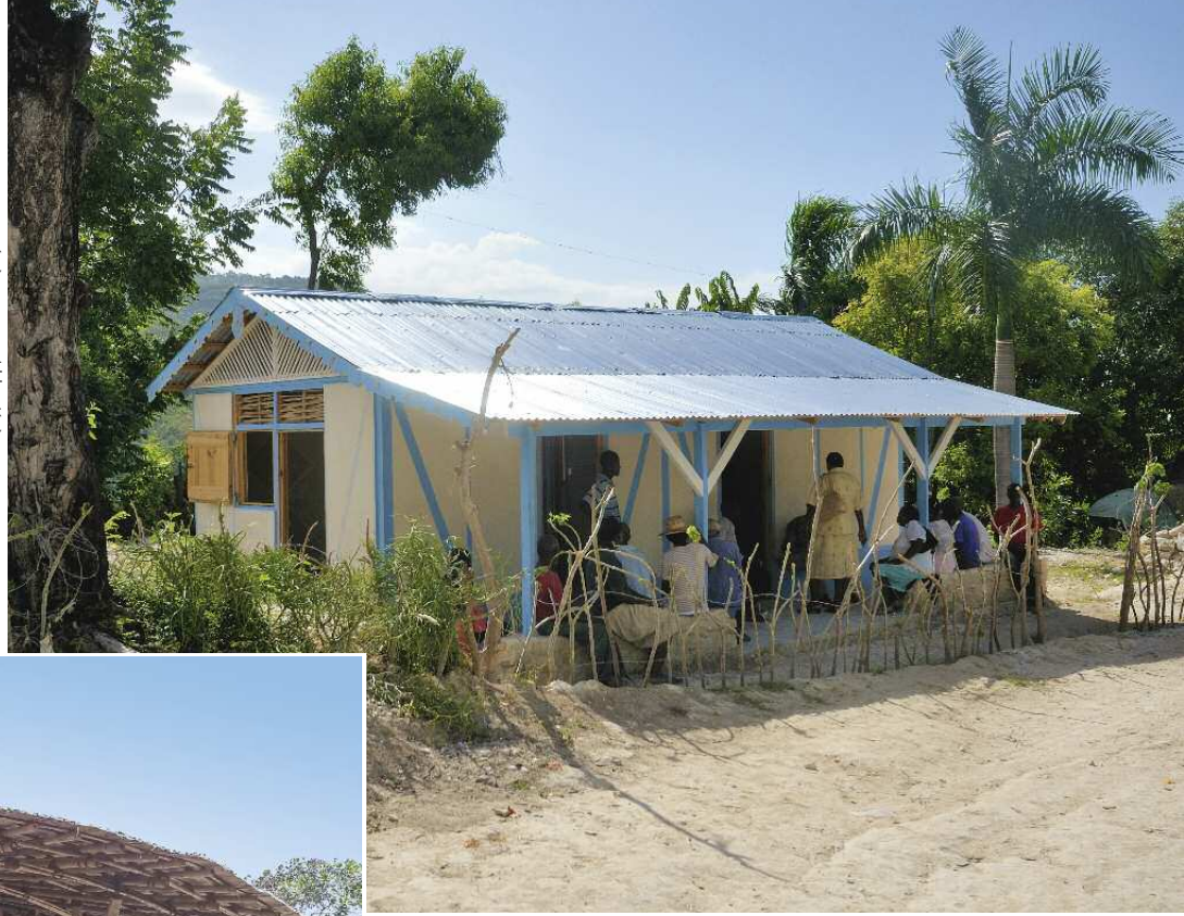
Haiti: Das in Selbsthilfe gebaute Wohnhaus ist in erdbebensicherer, traditioneller Bauweise in Holzrahmenkonstruktion mit Ausfachungen in Naturstein erstellt.

Holz zählt zu den nachwachsenden Baustoffen. Für die Produktion wird relativ wenig Energie benötigt und als Kohlendioxid- speicher ist Holz besonders klimagerecht und umweltschonend. Es weist hervorragende statische und bauphysikalische Eigenschaften