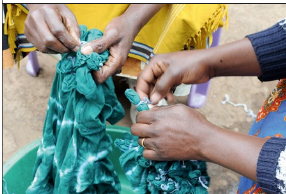
Färben von Batik-Mustern in Kenia

Aus den flauschigen Knäueln der Rohbaumwolle wird Garn gesponnen. In den Spinnereien arbeiten vorwiegend Frauen und manchmal auch Mädchen. An großen Webmaschinen wird das Garn dann zu Baumwollstoff verarbeitet.