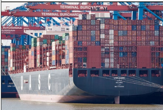
Containerschiff im Hamburger Hafen

Der Stoff wird zugeschnitten. Anschließend werden die Kleidungsstücke von Näherinnen und Nähern zusammengenäht. Das geschieht in Textilfabriken oder zu Hause in Heimarbeit.