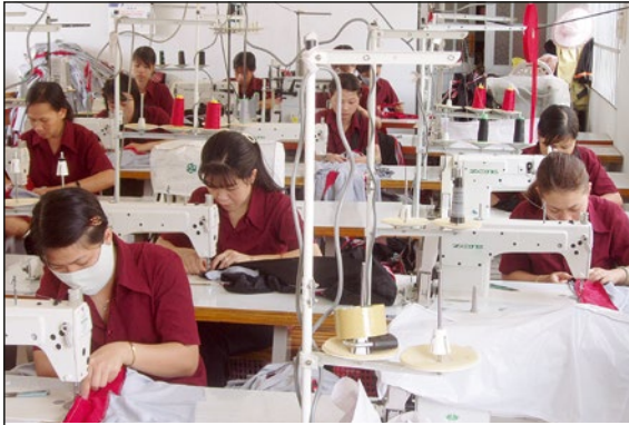
Frauen an Nähmaschinen