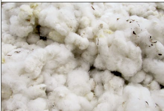
Geerntete Baumwolle im Senegal

Baumwolle ist der wichtigste Rohstoff für die Herstellung von T-Shirts. Sie wird in vielen Ländern angebaut, zum Beispiel in Westafrika, Indien, China oder im Süden der USA. Die Pflanzen benötigen viel Wasser und Sonne. Auf den Feldern arbeiten manchmal auch Kinder.