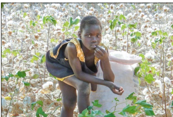
Junge pflückt Baumwolle in Burkina Faso