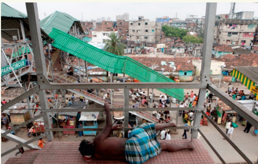
Lebenssituation in Kalkutta, Indien