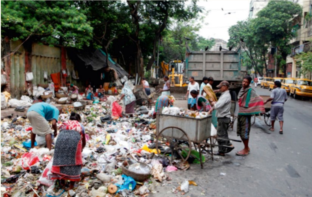
Müllproblematik in Kalkutta, Indien