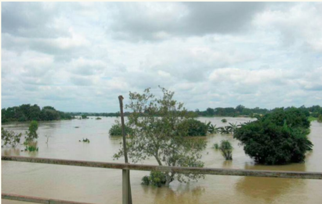
Überschwemmungen in Nigeria