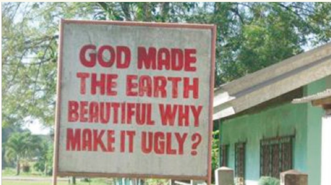
Plakat auf den Philippinen / November 2012