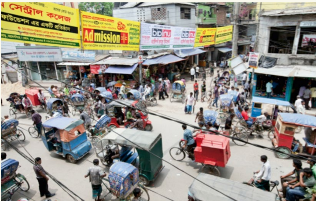
Verkehr in Mymensingh, Bangladesch