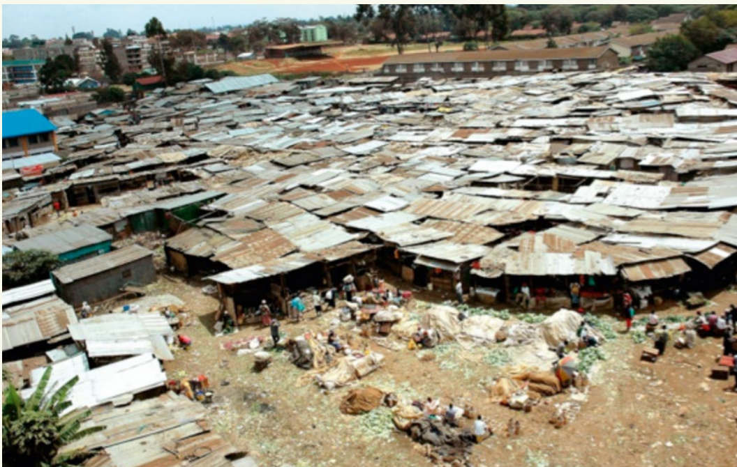
Slum in Nairobi, Kenia