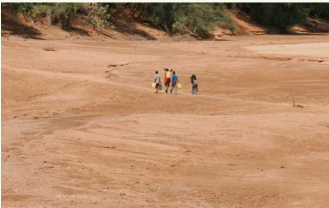
Trockenheit und Menschen beim Wasserholen in Kenia