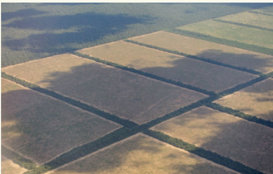
Monokulturen in der Landwirtschaft Argentiniens