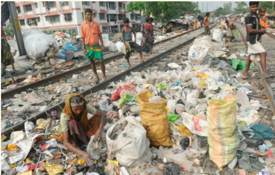
Müll auf den Straßen Indiens