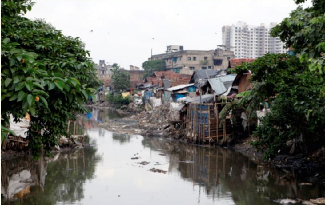
Fluss in Kalkutta, Indien