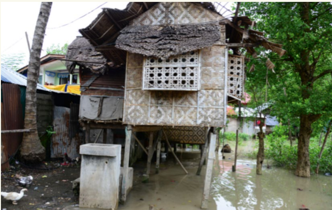
Vom Meer bedroht – Teile der Stadt Davao auf den Philippinen