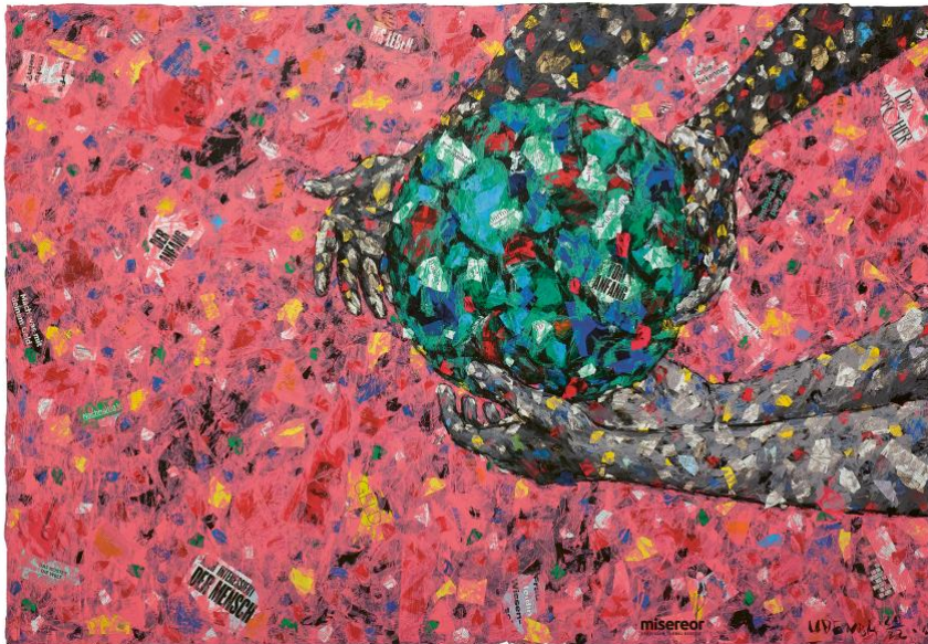
Das Misereor-Hungertuch 2023 „Was ist uns heilig?“ von Emeka Udemba © Misereor

Die Autorin ist Lehrerin und Teil des Teams „feel the pulse“. Das Projekt „Religionsunterricht am Puls der Zeit“ wurde 2019 von der Berufsgemeinschaft der Religionslehrerinnen und Religionslehrer in der Diözese Eisenstadt im Burgenland ins Leben gerufen. Auch zu vorherigen Misereor-Hungertüchern hat das Team bereits viele kreative Aktionen und Unterrichtsmodelle entwickelt. Mehr zu „feel the pulse“ finden Sie hier: https://www.martinus.at/feelthepulse