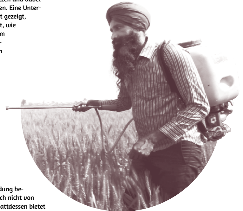
Indien: Farmer sprüht Pestizide ohne Schutzkleidung

Bayer ist das Problem der unsicheren Anwendung bekannt. Das Risiko hält das Unternehmen jedoch nicht von der Vermarktung hochgiftiger Pestizide ab. Stattdessen bietet Bayer Trainings an, um Landwirt*innen im Umgang mit Pestiziden zu schulen und geht dafür vorteilhafte Kooperationen mit staatlichen Institutionen ein – mit dem positiven Nebeneffekt, neue Kunden zu gewinnen.