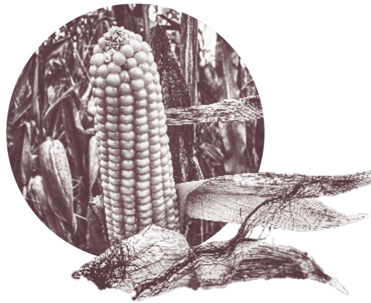
Monsanto's Genmais MON87460 wächst in fünf afrikanischen Ländern.

Bei WEMA geht es darum, Saatgut zu entwickeln, das auch in Dürreperioden noch gute Erträge bringt. Die entscheidende Komponente bei Monsanto's MON87460 ist dabei ein Gen für ein bakterielles Kälteschockprotein (cspB), das Pflanzen dabei unterstützt, bei Trockenstress wichtige Zellfunktionen aufrecht zu erhalten. In der Tat sind Ernteauffälle durch Dürren – verstärkt durch den Klimawandel – ein großes Problem in Subsahara-Afrika. Doch inwieweit Monsanto's Genmais verspricht, was er hält, ist ungewiss: Laut dem African Centre for Biodiversity (ACB), das Daten von Monsanto sowie des US-Landwirtschaftsministeriums untersucht hat, sind mit der genannten Sorte bei einer mittelschweren Dürre lediglich sechs Prozent weniger Ernteauffälle zu verzeichnen als bei herkömmlichem Mais – bei extremer Dürre kann die Ernte komplett ausfallen und weist somit keinerlei Vorteil auf. 16